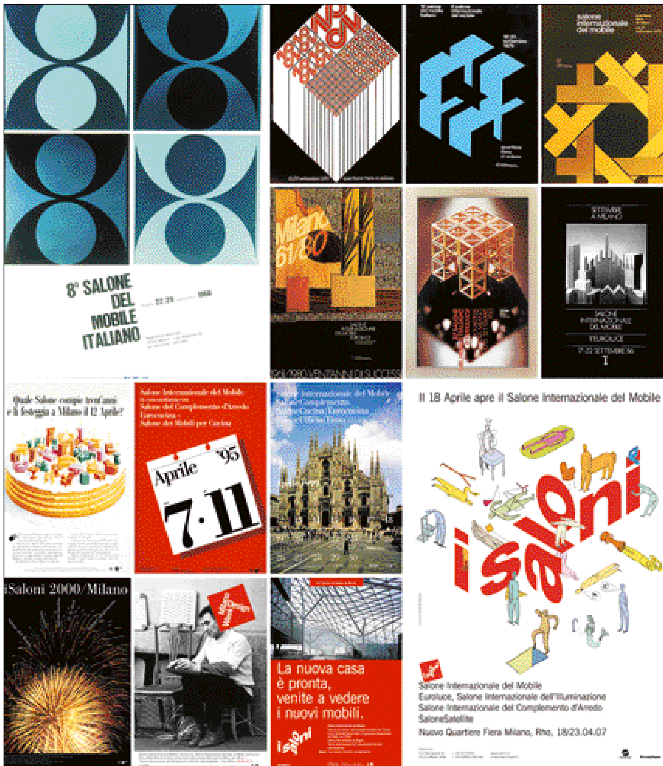
Manifesti del Salone del Mobile di Milano, 1968-2007